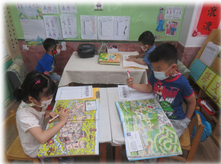
感力找感力在哪裡