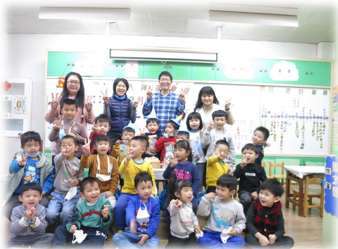
生日快樂—慶生會活動