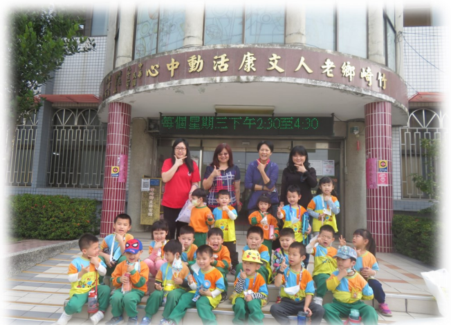
竹崎鄉立圖書館之旅