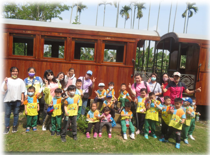
鹿麻產車站—檜木火車