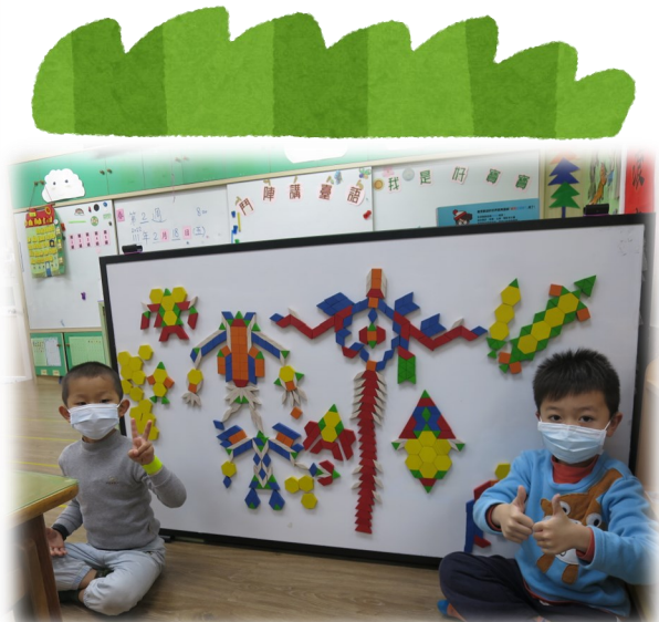
六形六色創意鋪排