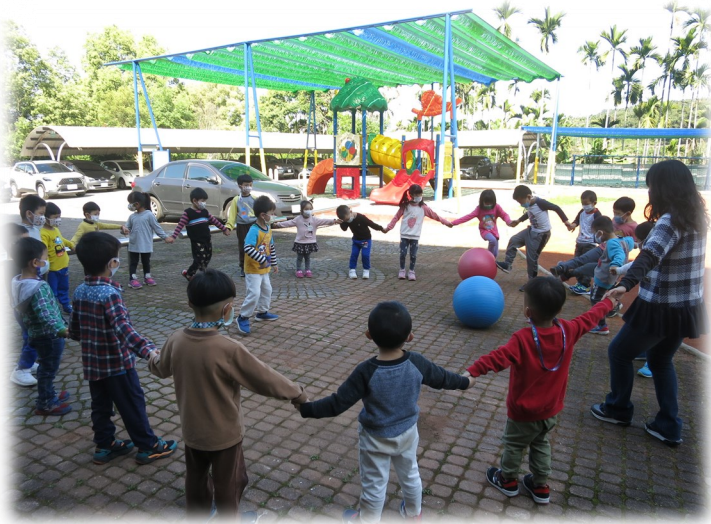
大肌肉活動—大龍球來了我不怕