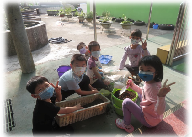
備土體驗種植的樂趣