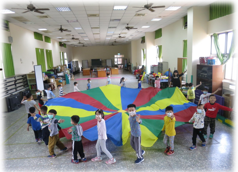
大肌肉活動—氣球傘散步趣