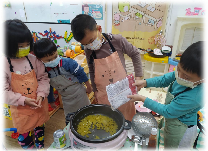
火車餐廳—義大利麵套餐