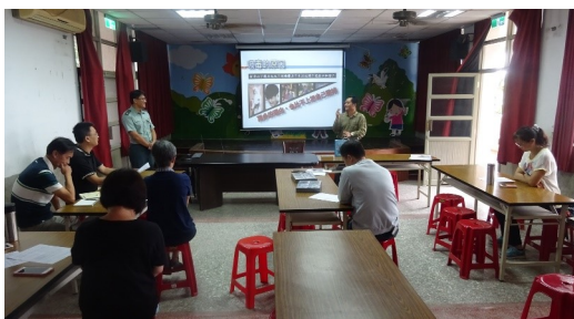
反毒智能教師研習活動