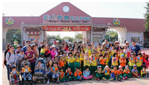
頑皮世界戶外學習活動