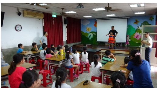
水域安全宣導活動