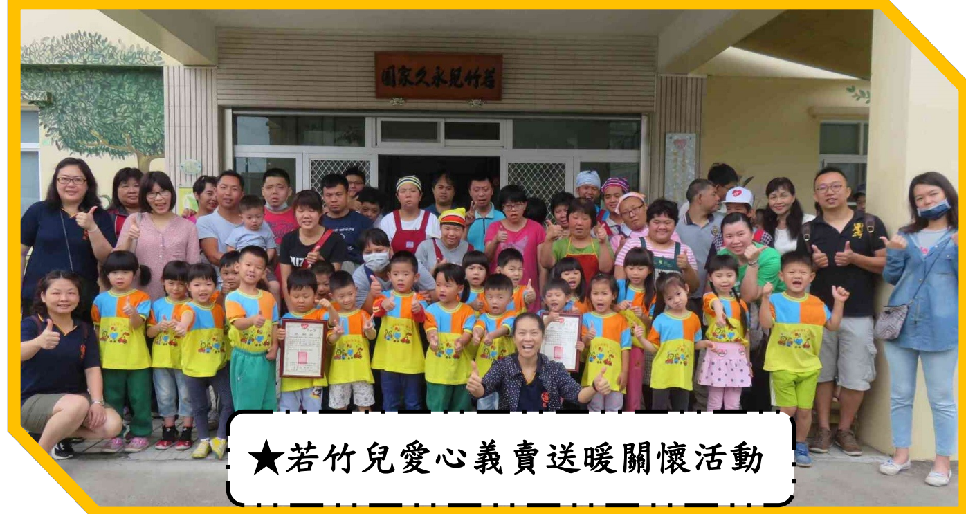
★若竹兒愛心義賣送暖關懷活動