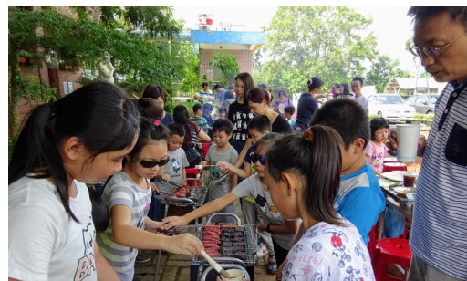
中秋節親子烤肉活動