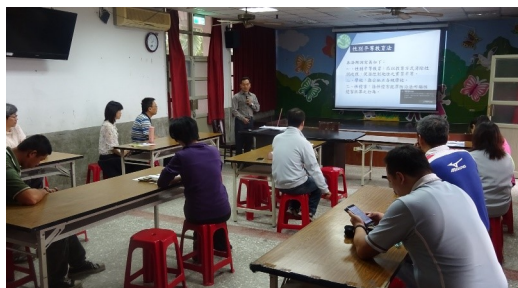
性別平等社區家長研習活動