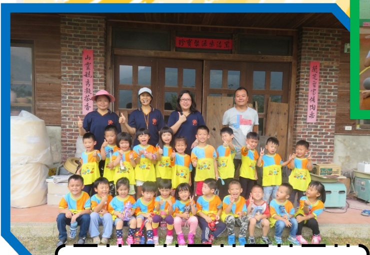
戶外教學蘭山工坊參訪