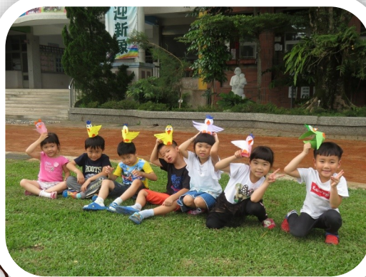
★主題立體動物藝術創作 彩色小鳥