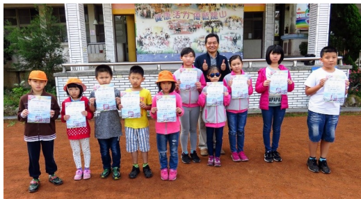
校長頒獎給優秀表現的同學