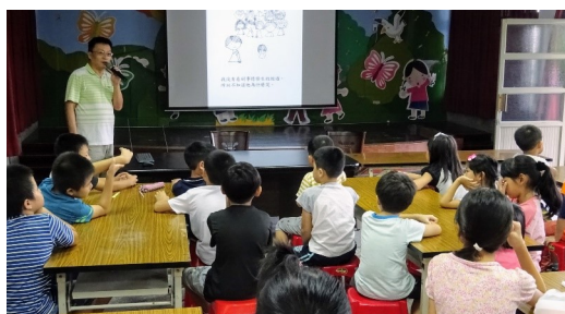
每週好書分享活動