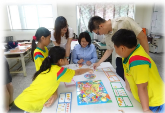
替代役哥哥和小朋友一起玩桌遊

在龍山國小的日子裡，看著你們成長、增長見聞，期許你們能學以致用，在求學的時光好好的去體會，沒有人一出生就是全能，但透過學習就會變成自己的，知識永遠是別人偷不走的財富。孔子說過「學而不思則罔，思而不學則殆」，學校的教育並不是只負責教你們如何讀書，還有透過書本給你們的知識去思考、判斷對錯。你們很幸運的活在一個資訊發達的時代，透過網路、電視、媒體就可以輕鬆地接收到不一樣的信息，好好的運用這些資源多聽、多看、多學，人之所以為動物之首，就是因為懂得思考，懂得溝通，懂得運用資源，所以不要浪費了自己的才能，你們每一個人都是獨特的，期望你們在學習的道路上找到自己未來的目標。