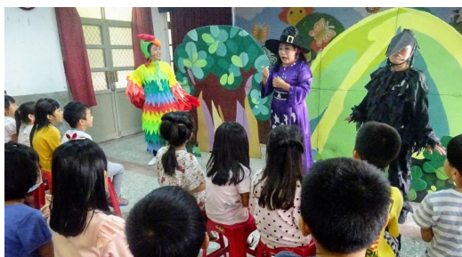
小茶壺劇團菸害防制宣導