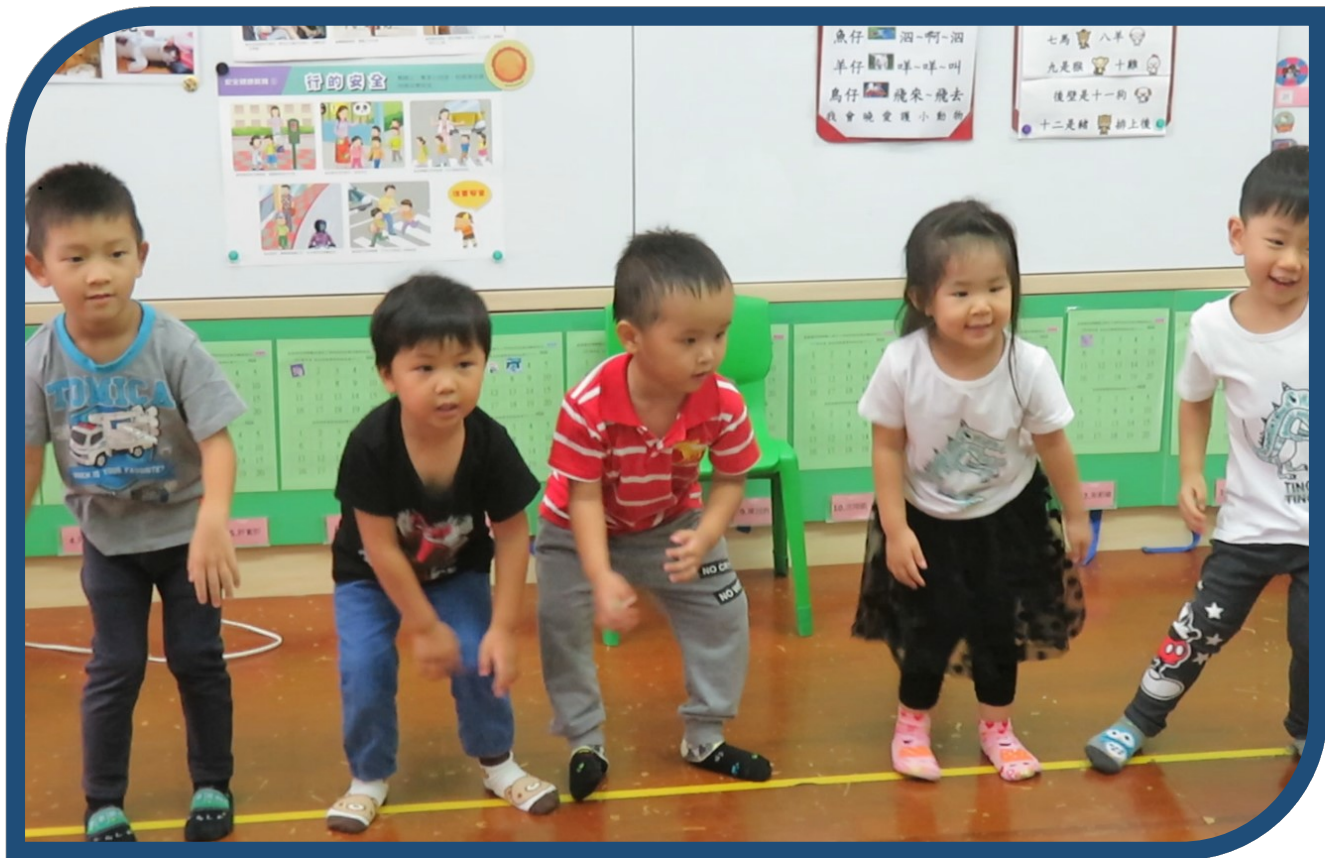
★閩南語囡仔歌—「規身驅來振動」表演