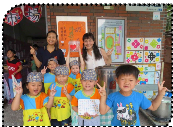
主題活動愛心義賣跳蚤市場