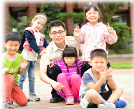
替代役哥哥是小朋友的好朋友

時光飛逝，一轉眼在學校當替代役的時間已經接近了尾聲，回首一望，接近一年的時間，隨著你們一起成長，是我在這裡最大的收穫，這段時間是否有在你們記憶中留下了一點回憶呢？成長的道路有些人就是生命中的過客，有些人會影響你一輩子，服役這段期間是在我成長中重要的一個時光。那麼有哪些人、事、物在你們記憶中佔據著重要的地位呢？