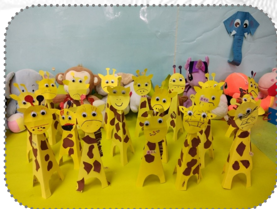
★立體動物藝術創作 長頸鹿