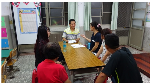
班親會校長與家長對談