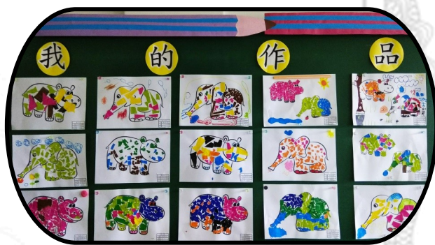
動物好朋友主題藝術撕貼 畫創作作品