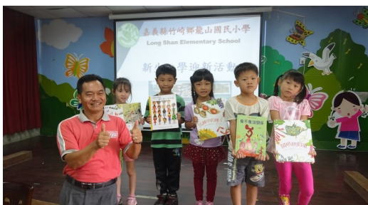
校長與一年級新生合影