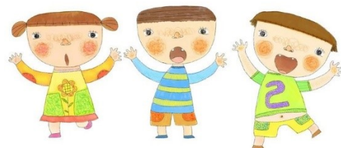
★慶祝母親節媽咪萬歲