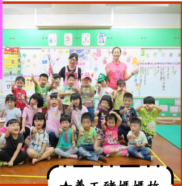
★義工豬媽媽故事分享活動