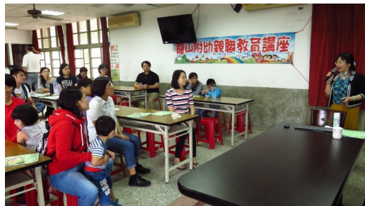
辦理幼兒園親職教育活動