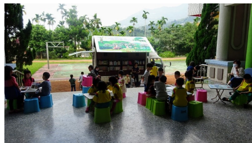
圖書車到校進行閱讀活動