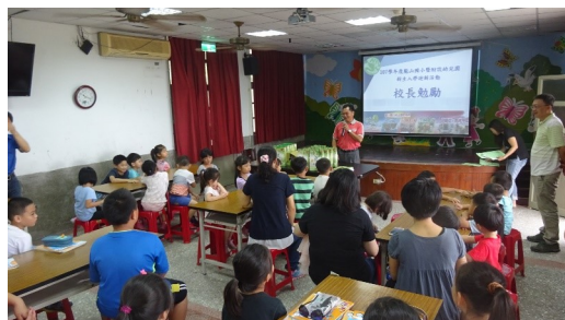
新生歡迎活動-校長致詞