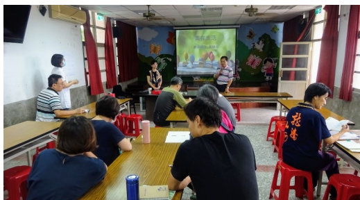
美感教育教師研習活動