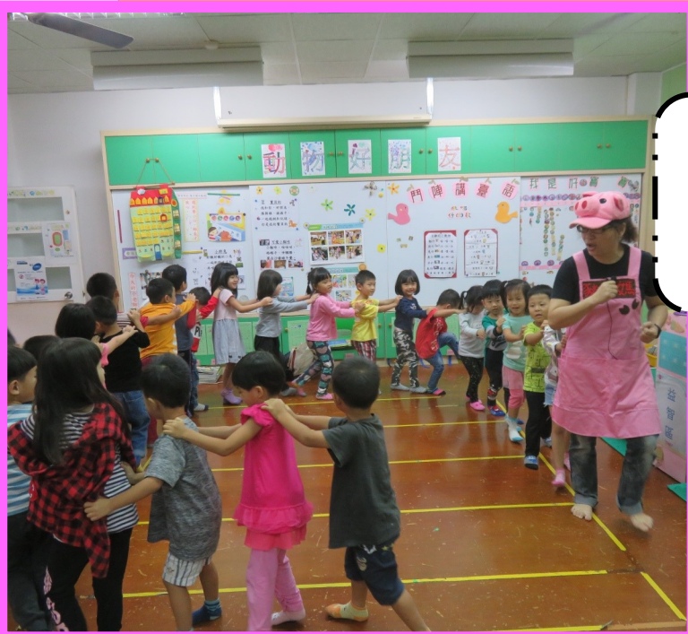
★義工豬媽媽故事分享和遊戲活動