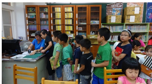
學生踴躍到圖書室借書