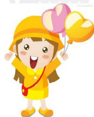
★迎新會~歡迎 107 年度入學小寶貝