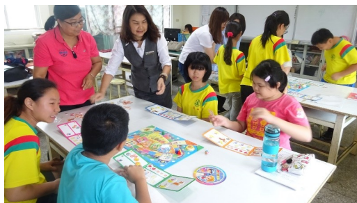
理財小達人桌遊活動