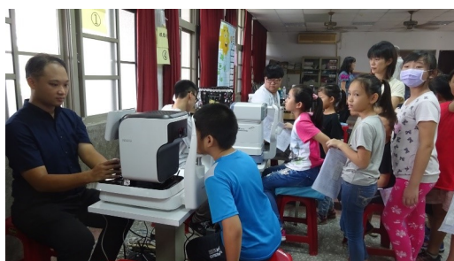
長庚醫療團隊到校檢查視力