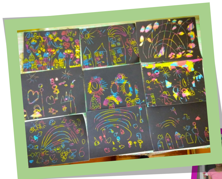
★慶祝107年雙十節 刮畫創作作品