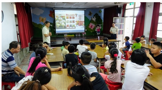
營養教育宣導活動