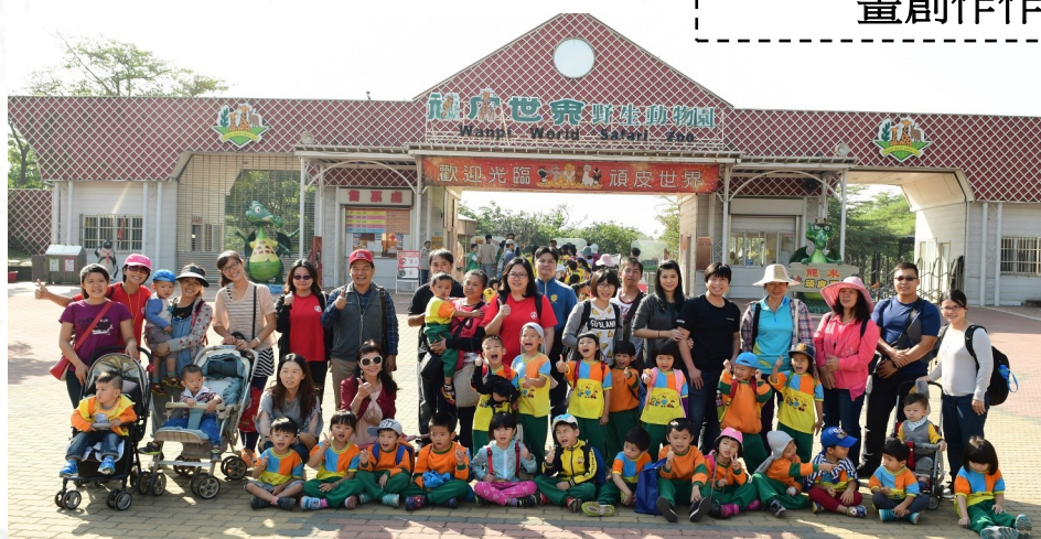
主題活動頑皮世界親子戶外教育