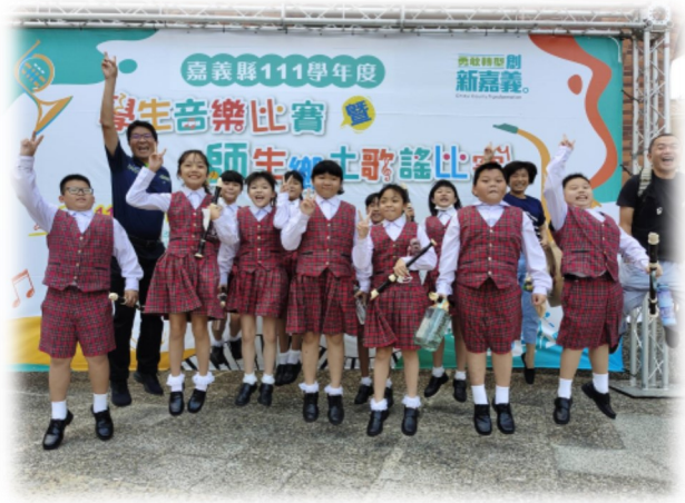
學生音樂比賽一直笛吹奏我最優