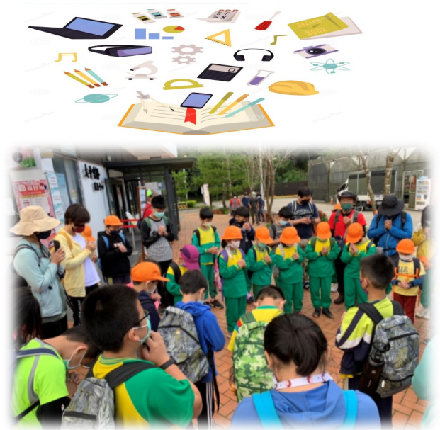
山野教育-親山近山敬山