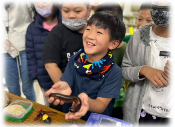
立賢超能力解鎖課程—勇敢