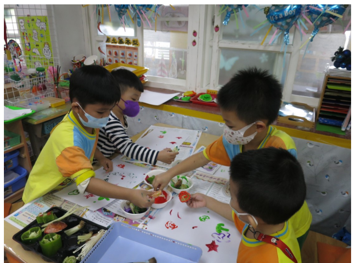
美勞創作-蔬果蓋印章