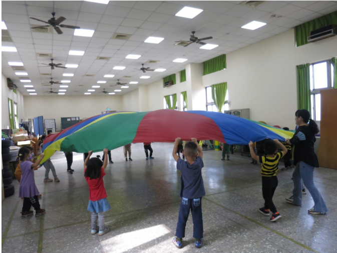
大肌肉活動-氣球傘變變變