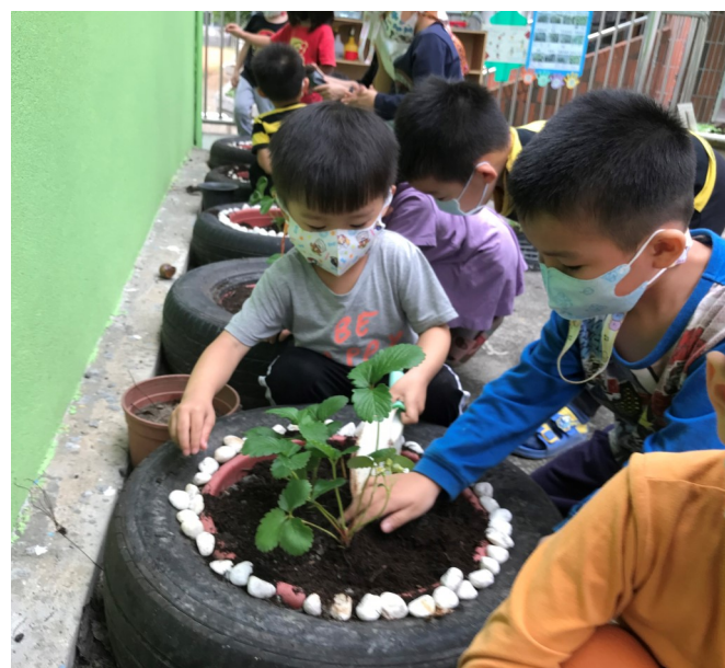
食農教育—種植草莓初體驗