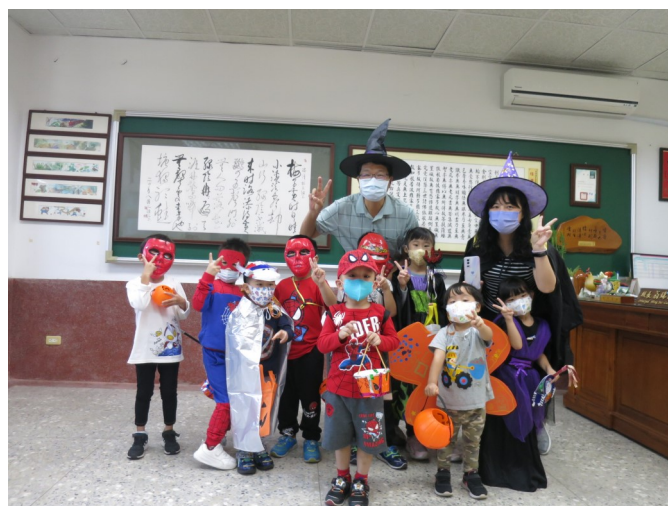
萬聖節之分享快樂分享愛