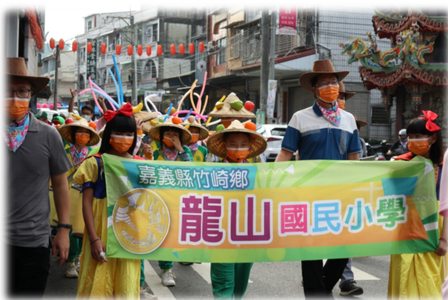
「童心・足柑心」—龍山水果兵踩街