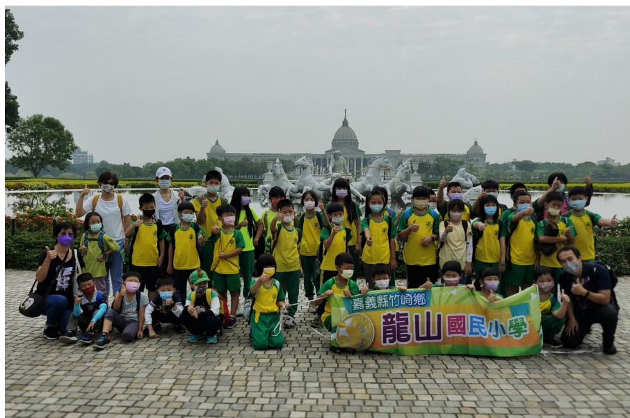
藝文場館體驗之旅—奇美博物館