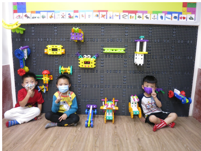
組合建構區之齒輪積木創作