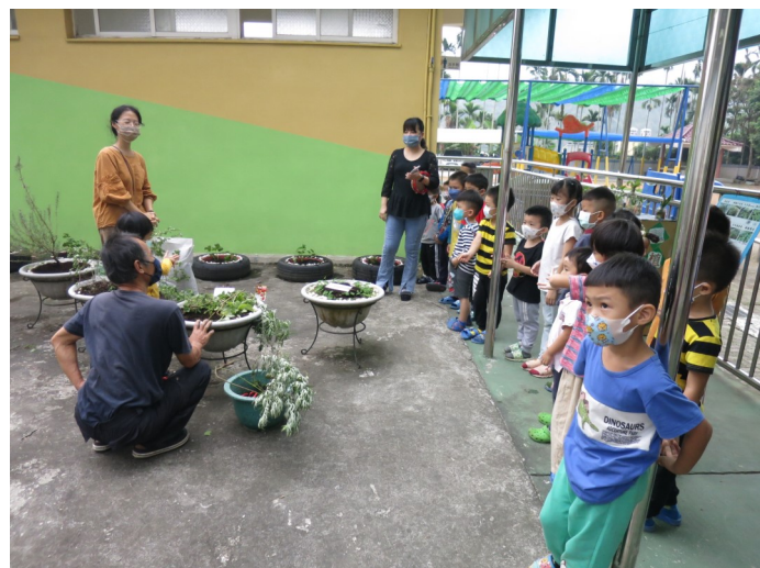
認識常用的香草植物