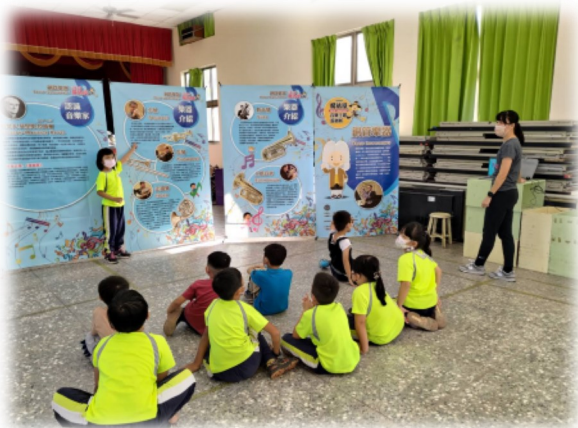
研揚音樂魔法屋-古典樂饗宴