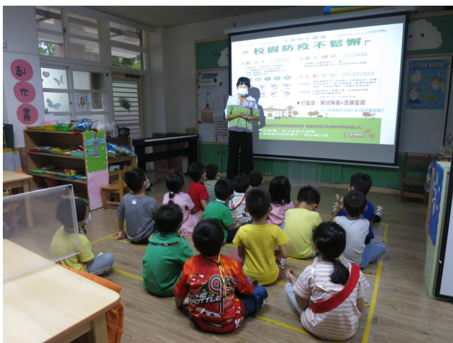
護理師入班進行防疫宣導