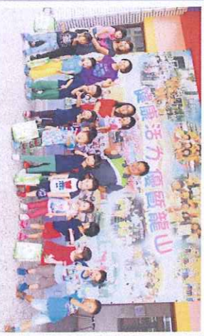
校長與幼兒園新生相見歡