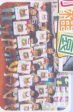
中秋節快樂-雖然我們不認識您！但感恩善心人士您送的月餅。