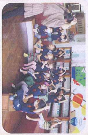
鄉土戶外教學-參觀圖書館-白雪公主老師說故事