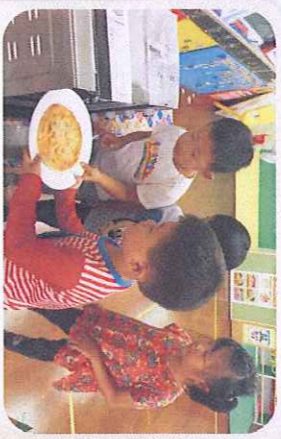
動手做點心-烤香噴噴的披薩囉~