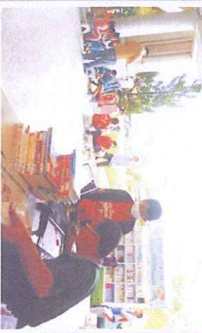
雲水書車來了，我們快去借書吧！