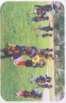
飛盤遊戲-多到戶外運動身體健康又開心！