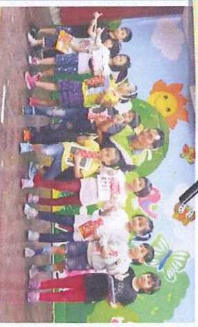
小一新生贈書，校長期勉要多閱讀哦！