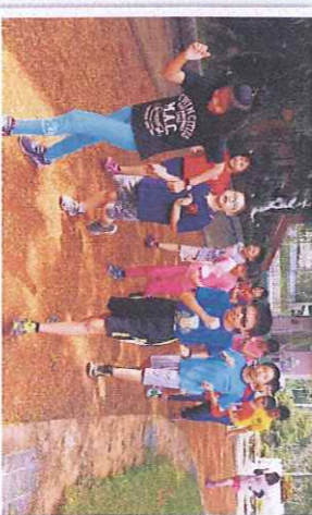
農間健走，看我們健步如飛！