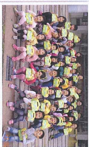
感恩善心人士透過喜憨基金會送我們麵包