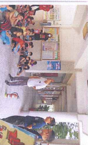
消防局的大哥哥教導防火、防震