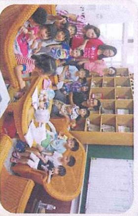
認識校園-參觀校長室-哈囉！校長您好！