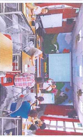
班親會家長踴躍參加