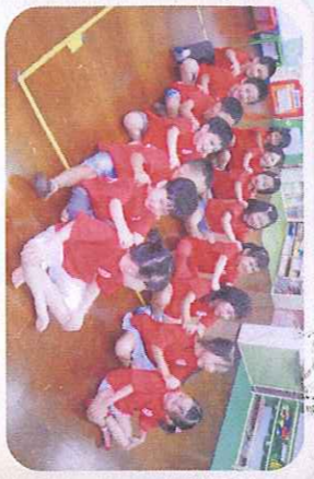
暑期心靈靜瑜伽音樂營-按摩樂遊戲