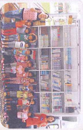
看書悅讀時光-感恩-佛光山雲水書坊-行動圖書館蒞校-