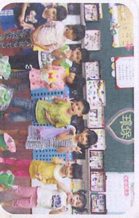
愛護地球-環保小天使-廢乾電池回收