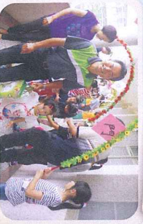
迎新活動-歡迎寶貝們加入龍山家族-過平安、健康、聰明...Pg