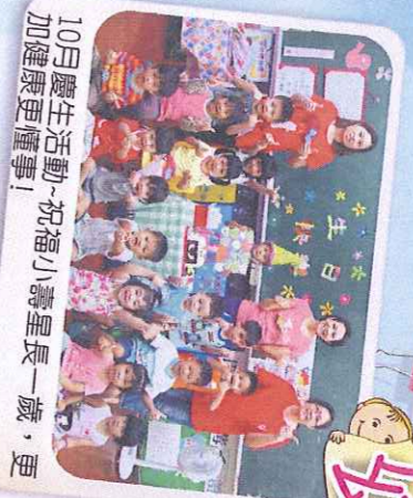
10月慶生活動-祝福小壽星長一歲，更加健康更懂事！